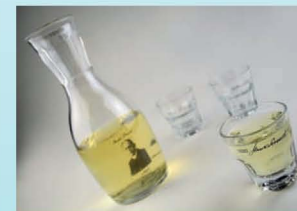
Spominek na zgodbo o slovenski himni

Povabljeni v Podnanos št. Vid, rojstni kraj slovenske himne