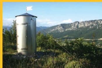
Kopija Aljaževega stolpa na Kjeclu

Podnanos, nekdanj Šembid. Gručasto naselje v Zgornji Vipavski dolini, ob cesti Vipava – Razdrto, kjer se odcepi cesta čez Vrabče na Kras in se dolina potoka Močilnika razširi. Rojstni kraj slovenske himne. Kraj, kjer vas čakajo ljudje, rojeni na burji: temperamentni in gostoljubni. Številni pridelovalci vrhunskih vin, predvsem avtohtonega Zelena in Pinele, vam z veseljem odprejo vrata svojih velbanih hramov. Po degustaciji vam v Turističnem društvu Podnanos organizirajo voden ogled Podnanosa in okolice. Lahko pa si sami privoščite sproščene sprehode po tipičnih ozkih gasah, pa tudi daljše planinske pohode do sv. Miklava, sv. Trojice in drugih bližnjih cerkva. Ali pa se odpravite malo dlje, do sv. Hieronima na Nanosu, obiščete Lovsko in Vojkovo kočo ter iz Nanoške planote opazujete razgled na Podnanos in njegove zaselke ter ob lepem vremenu ujamete obzorje vse do bližnje Italije. Za zaključene skupine vam domačini pripravijo druženje s pravim domačim gurmanskim doživetjem. Če si med njimi želite ostati dlje, vam nudijo tudi prijetno urejena prenočišča. Kakšno kulturno, predvsem pa nasmejano urico, vam pričara dramska skupina Ga Pihnemo. Poleg doživetja kraja, ki ne more v pozabo, so v pisarni Turističnega društva za trajen spomin na voljo čebelarski izdelki, vina, pesniške zbirke naših ustvarjalok, turistični vodiči in drugi spominki. Pričakujemo vas. V Podnanosu. V rojstnem kraju slovenske himne.