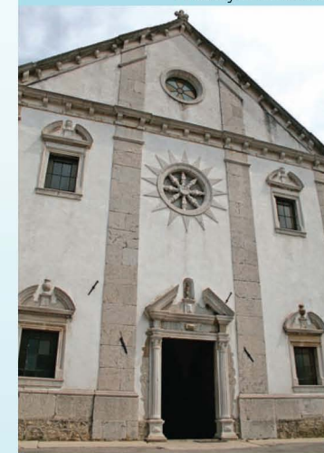
Pročelje župnijske cerkve sv. Vida