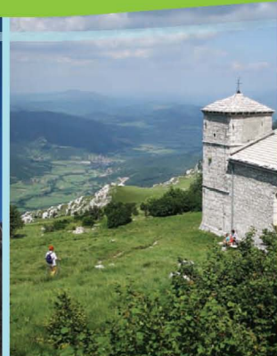
Cerkev sv. Hieronima na Nanosu