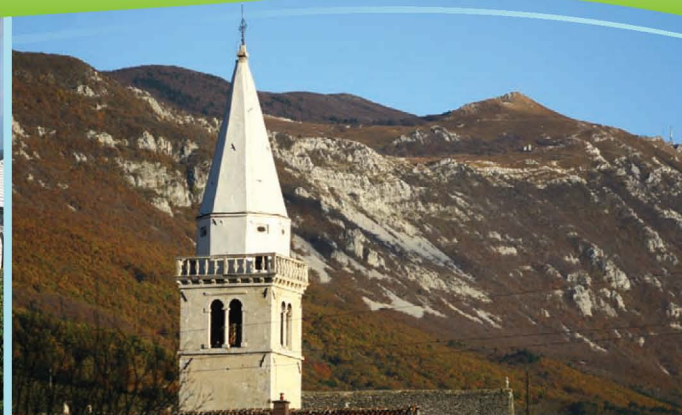
Panorama Nanosa, v ozadju Grmada