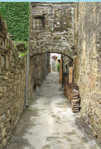
Ulice - gase v jedru Podnanosa