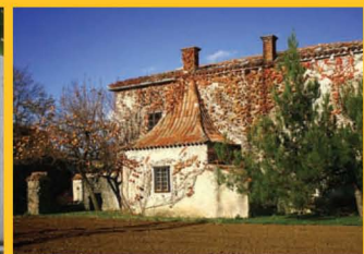
»Spahnjenca« - Zajčji grad