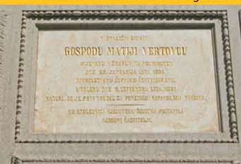
Spominska plošča Matiji Vetovcu