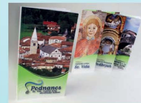
Vodnik in zganbanke »znamenitosti Podnanosa«

In prav njegov napev se je mnogo kasneje trajno usidral v slovenska domoljubna čustva, saj smo ga Slovenci skupaj s 7. kitico Prešernovega besedila izbrali za slovensko himno, kar določa 6. člen Ustave Republike Slovenije. Slovenska himna torej ni le Prešernova, marveč tudi in predvsem Premrlova.