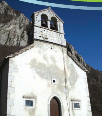
Cerkev sv. Miklavža pod Goro