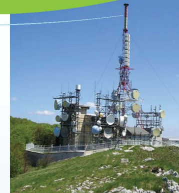
TV oddajnik na Nanosu

Podnanos, nekdanj Šembid. Gručasto naselje v Zgornji Vipavski dolini, ob cesti Vipava – Razdrto, kjer se odcepi cesta čez Vrabče na Kras in se dolina potoka Močilnika razširi. Rojstni kraj slovenske himne. Kraj, kjer vas čakajo ljudje, rojeni na burji: temperamentni in gostoljubni. Številni pridelovalci vrhunskih vin, predvsem avtohtonega Zelena in Pinele, vam z veseljem odprejo vrata svojih velbanih hramov. Po degustaciji vam v Turističnem društvu Podnanos organizirajo voden ogled Podnanosa in okolice. Lahko pa si sami privoščite sproščene sprehode po tipičnih ozkih gasah, pa tudi daljše planinske pohode do sv. Miklava, sv. Trojice in drugih bližnjih cerkva. Ali pa se odpravite malo dlje, do sv. Hieronima na Nanosu, obiščete Lovsko in Vojkovo kočo ter iz Nanoške planote opazujete razgled na Podnanos in njegove zaselke ter ob lepem vremenu ujamete obzorje vse do bližnje Italije. Za zaključene skupine vam domačini pripravijo druženje s pravim domačim gurmanskim doživetjem. Če si med njimi želite ostati dlje, vam nudijo tudi prijetno urejena prenočišča. Kakšno kulturno, predvsem pa nasmejano urico, vam pričara dramska skupina Ga Pihnemo. Poleg doživetja kraja, ki ne more v pozabo, so v pisarni Turističnega društva za trajen spomin na voljo čebelarski izdelki, vina, pesniške zbirke naših ustvarjalok, turistični vodiči in drugi spominki. Pričakujemo vas. V Podnanosu. V rojstnem kraju slovenske himne.