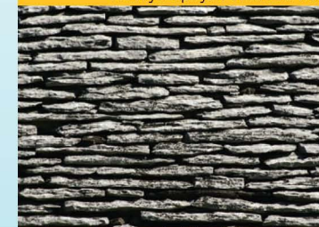
Cerkev sv. Vida - ena največjih skratih streh Evrope