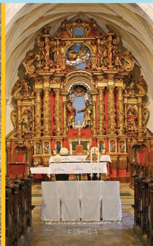
Cerkev Sv. Kozma in Damjana v Podbrjrah